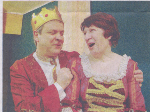
Le roi Albert, tout en majesté...

La troupe de l'Elsasser Theater de Raedersdorf retrouve les planches samedi soir en s'inspirant de Jacques Offenbach pour faire de son Barbe Bleue un spectacle... poilant!