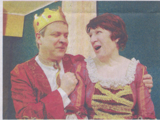
Le roi Albert, tout en majesté...

La troupe de l'Elsasser Theater de Raedersdorf retrouve les planches samedi soir en s'inspirant de Jacques Offenbach pour faire de son Barbe Bleue un spectacle... poilant!