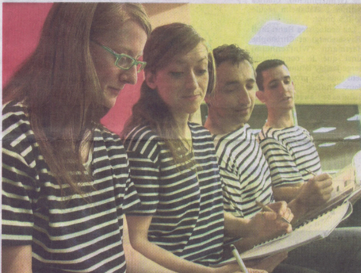
Il fallait au moins une équipe de secrétaires pour épauler l'homme d'affaires !

■ Samedis 26 mars, 2 et 9 avril ainsi que les vendredis 1 er et 8 avril à 20 h 30, à la salle des fêtes de Raedersdorf. Entrée : 8 €. renseignements au 03 89 07 50 94.