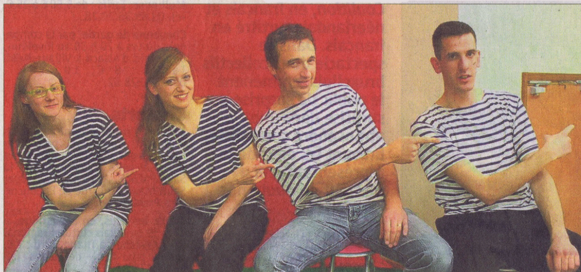
Une équipe de secrétaires autant occupés à soulager leur patron à ne rien faire qu'à assurer l'ambiance d'une pièce comique et burlesque.