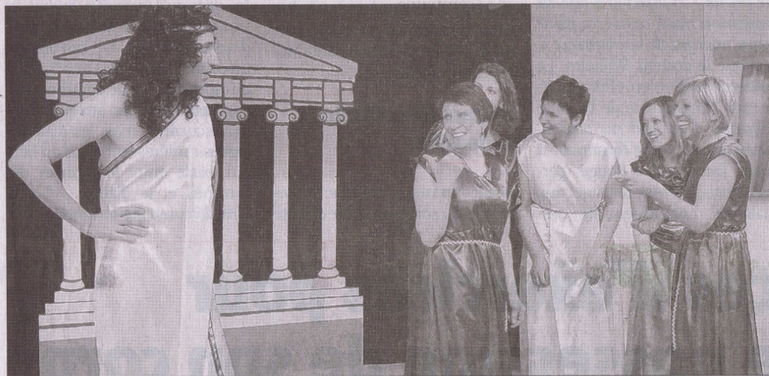
Les femmes ont décidé de tourner les hommes et leur politique en dérision.

« Wenn D'Frauia regiara », (Quand les femmes dirigent) est une adaptation libre d'une œuvre du dramaturge et philosophe grec Aristophane, auteur de « L'assemblée des femmes ». « Autrefois, en Grèce, la politique était réservée exclusivement aux hommes. Les femmes devaient se contenter d'obéir. Jusqu'au jour où elles décident de prendre le pouvoir par ruse. » Les hommes tentent de ne pas se laisser faire, mais les femmes ont des arguments pour passer outre. Elles iront même jusqu'à faire la grève du sexe ou utiliseront divers artifices pour prendre le dessus, par la ruse, la moquerie, le persiflage ou encore