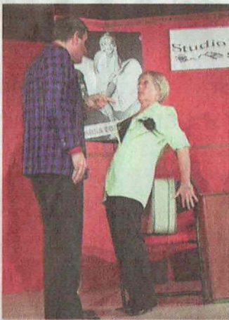
Le producteur de cinéma s'en prend à son employée.

« Tel est Schpountz, qui croyait prendre ! ». l'Elsasser Theater propose ses dernières représentations de Kino-Fiaber, librement adapté du film de Marcel Pagnol.